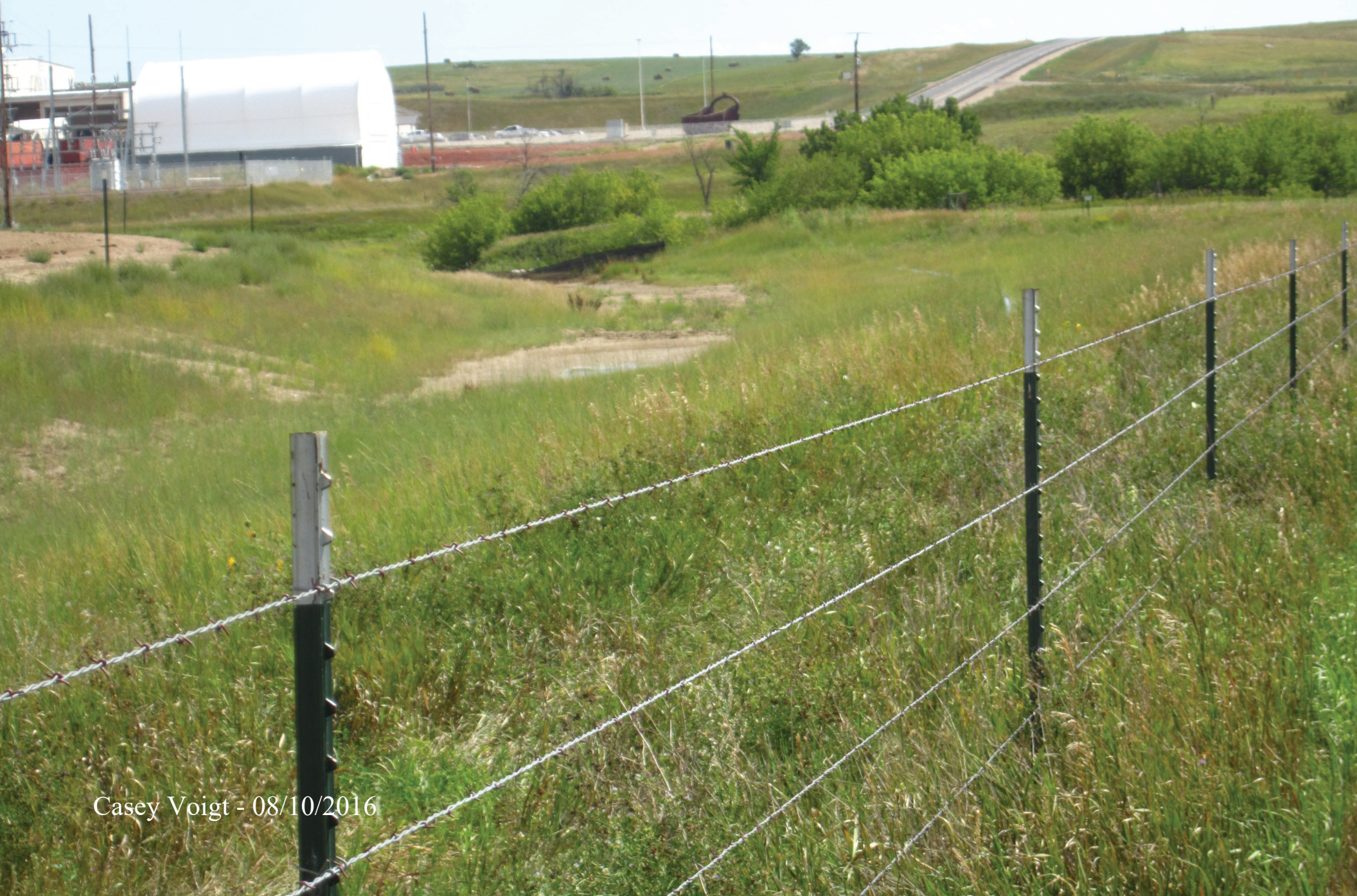
Casey Voigt - 08/10/2016