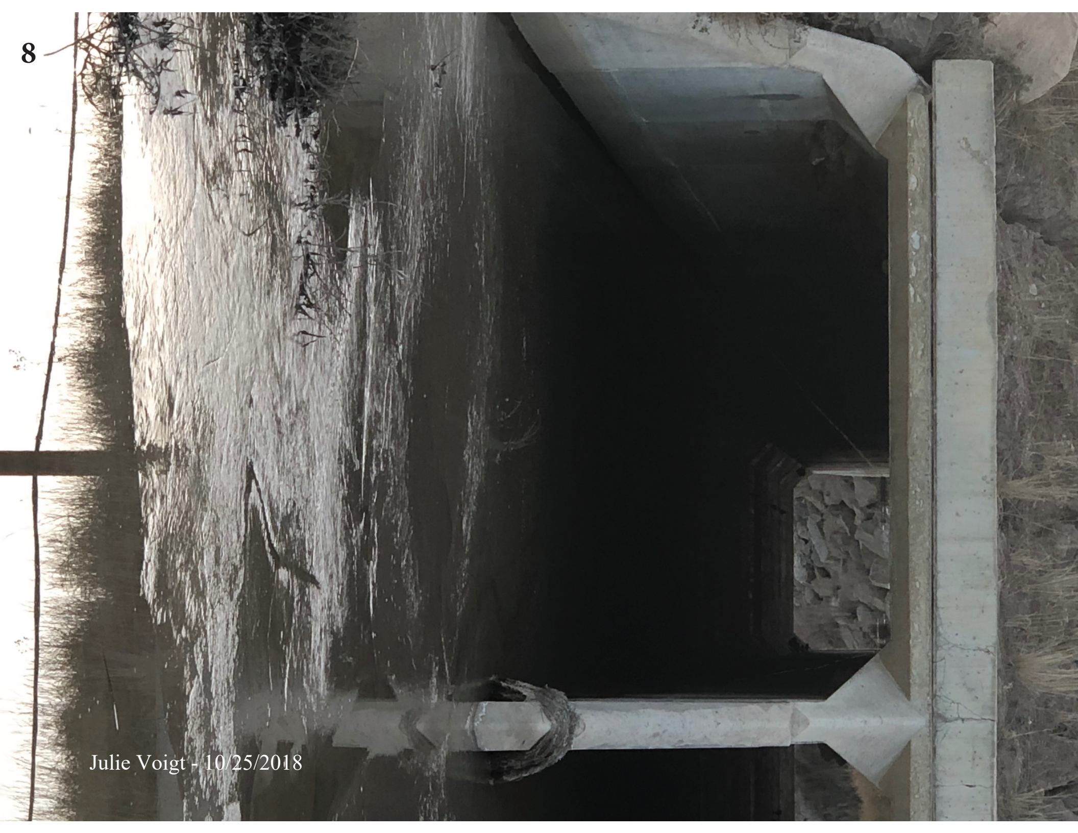
Julie Voigt - 10/25/2018